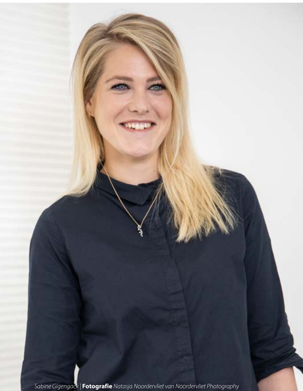
Sabine Gigengack

diagnose. Sommige verzekeraars, maar ook belangenbehartigers hebben helaas een te eenzijdig beeld van herstelcoaching.